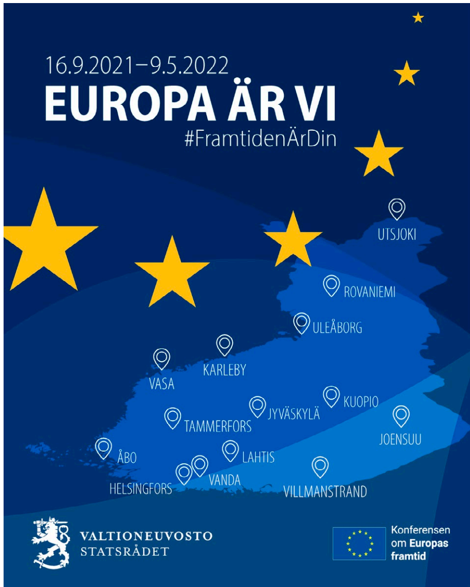
Städer där "Europa är vi"-turnéet tog plats.